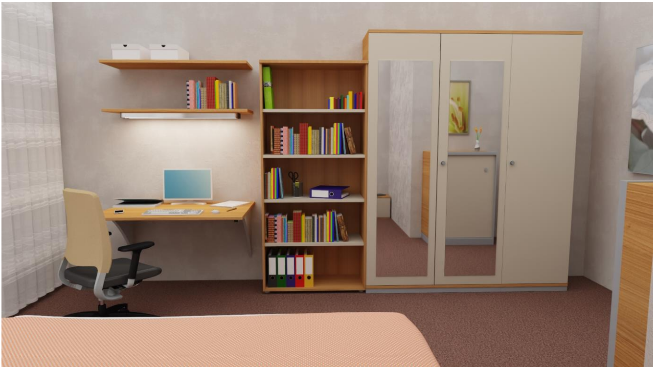
Bild 3: mögliche Einrichtung eines mobilen Arbeitsplatzes – Kategorie FUNKTIONAL als Telearbeitsplatz