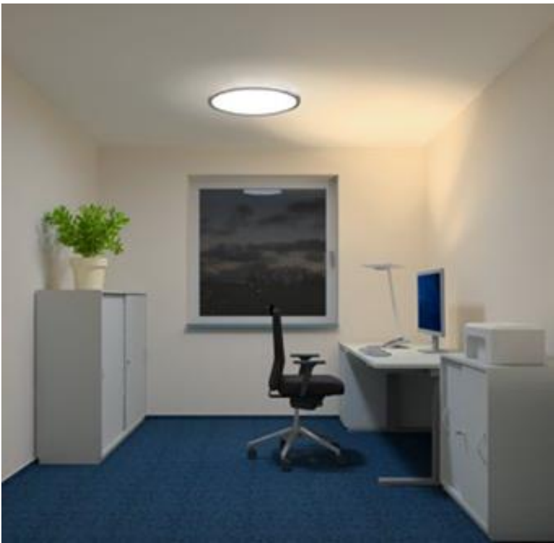
Bild 5: Beispiel für eine Beleuchtungssituation im Homeoffice (aus: DGUV Information 215-442 „Beleuchtung im Büro“)

Die Bildschirmgeräte sollten so aufgestellt werden, dass deren Oberflächen frei von störenden Reflexionen und Blendungen sind. Der Arbeitsplatz soll ausreichend hell sein (500 Lux). Dies kann ergänzend zur häuslichen Beleuchtung zum Beispiel mit einer Stehleuchte oder einer Tischleuchte erreicht werden.