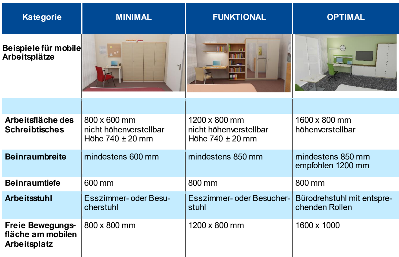
Tabelle 1: Auszug aus FBVW-401 „Mobiles Arbeiten in Hotels“

Die dort beschriebenen Rahmenbedingungen können auch beim Einrichten von mobilen Arbeitsplätzen im privaten bzw. häuslichen Umfeld herangezogen werden. Dabei sind auch beliebige Kombinationen der verschiedenen ergonomischen Empfehlungen möglich. So ist ein Büroarbeitsstuhl vor einer minimalen Tischplatte sicher ergonomisch günstiger als nur der Esszimmerstuhl oder Besucherstuhl. Und auch eine große Tischplatte eines optimalen Schreibtisches ist ergonomisch günstiger als eine Tischplatte der Kategorie FUNKTIONAL, selbst wenn der Tisch nicht höhenverstellbar ist.